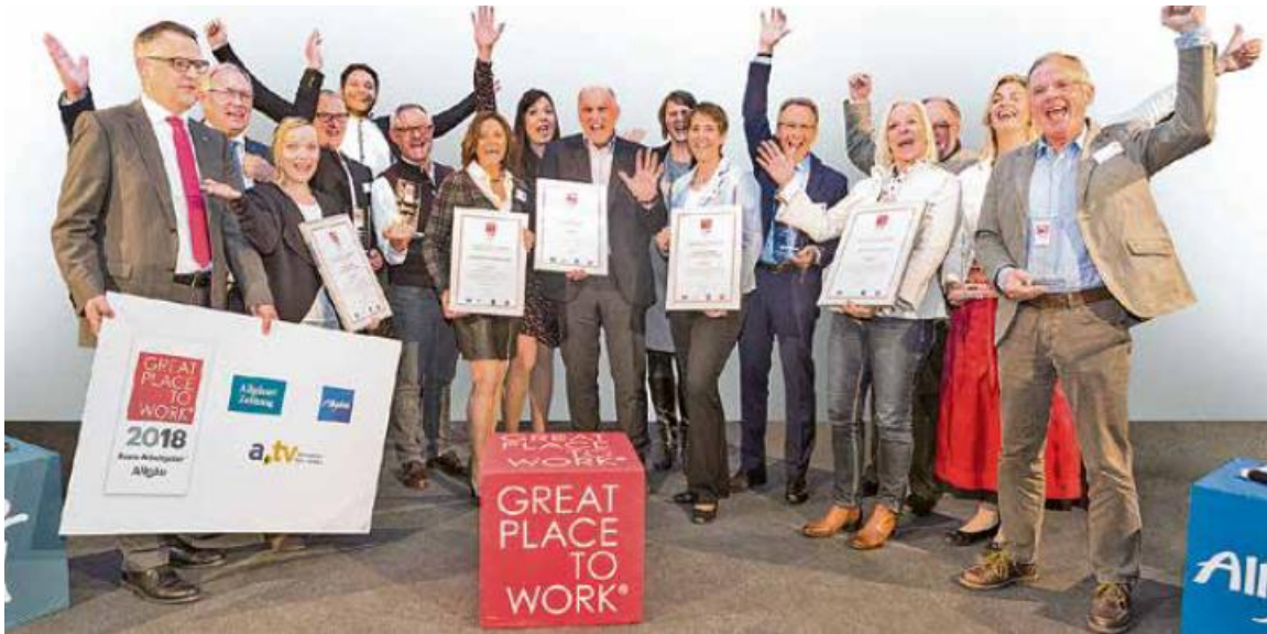
Die Sieger des Wettbewerbs „Beste Arbeitgeber Allgäu 2018“.