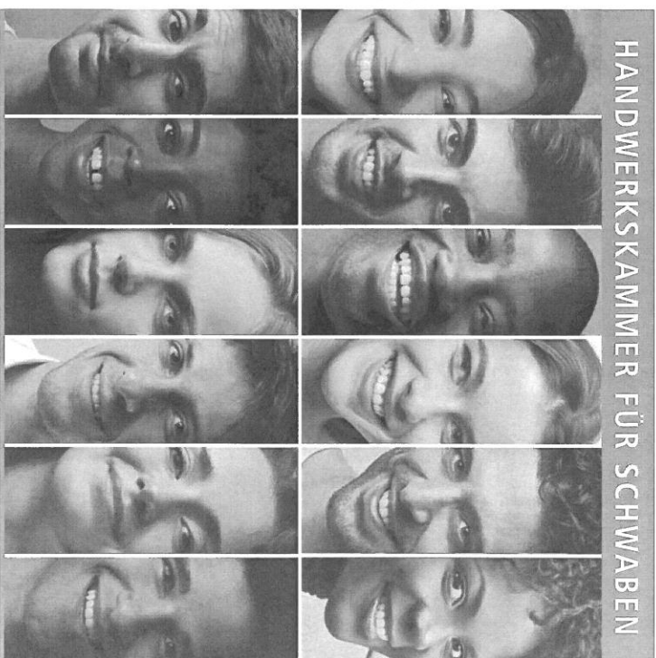
Stand 5/2016 · Gedruckt auf 100 % Recyclingpapier